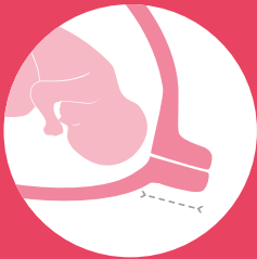
steif & lang

Eine Frühgeburt kann ohne vorherige Anzeichen auftreten. Ein wichtiger Indikator zur Bestimmung des Frühgeburtsrisikos ist die Beschaffenheit des Gebärmutterhalses (Zervix).