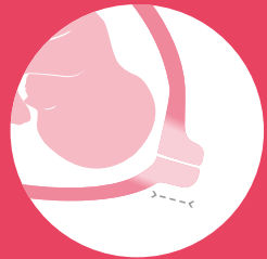
souple & court